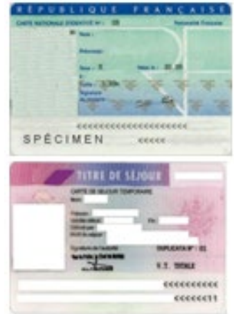
Une copie recto/ verso du justificatif d'identité de la personne concernée par la demande